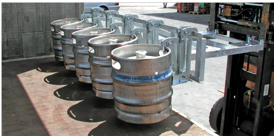
Auch Sonderkonstruktionen lieferbar: z.B. für 30- / 50-l-Bierfässer